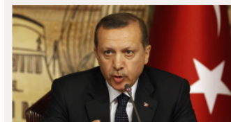
El ministro de Asuntos Exteriores de Turquía, Mevlüt Cavusoglu, ha advertido este martes de que su Gobierno suspenderá el pacto con la ...

Hillary Clinton, la mujer que no se conformó con ser primera dama