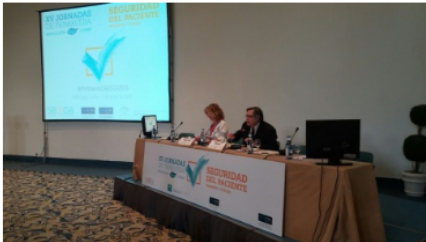
Imagen de los ponentes en la jornadas