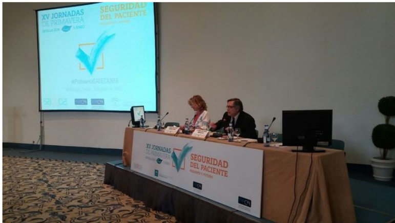
Más de 200 profesionales se reúnen en Sevilla para compartir experiencias sobre seguridad del paciente SEVILLA | EUROPA PRESS