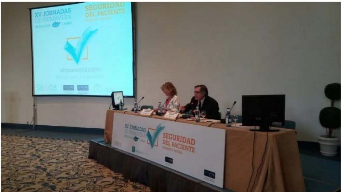
Inauguración Jornadas Primavera SADECA